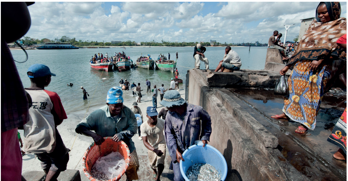
Dar es Salaam, Tanzania

Hav for utvikling vil skaleres opp gradvis, med en begrenset satsing i 2020. Styringsdokumentet gjelder for perioden 2020–2025. I 2023 vil det gjennomføres en midtveisgjennomgang som vil inkludere anbefalinger om eventuelle justeringer. Det legges også opp til en evaluering i 2025.