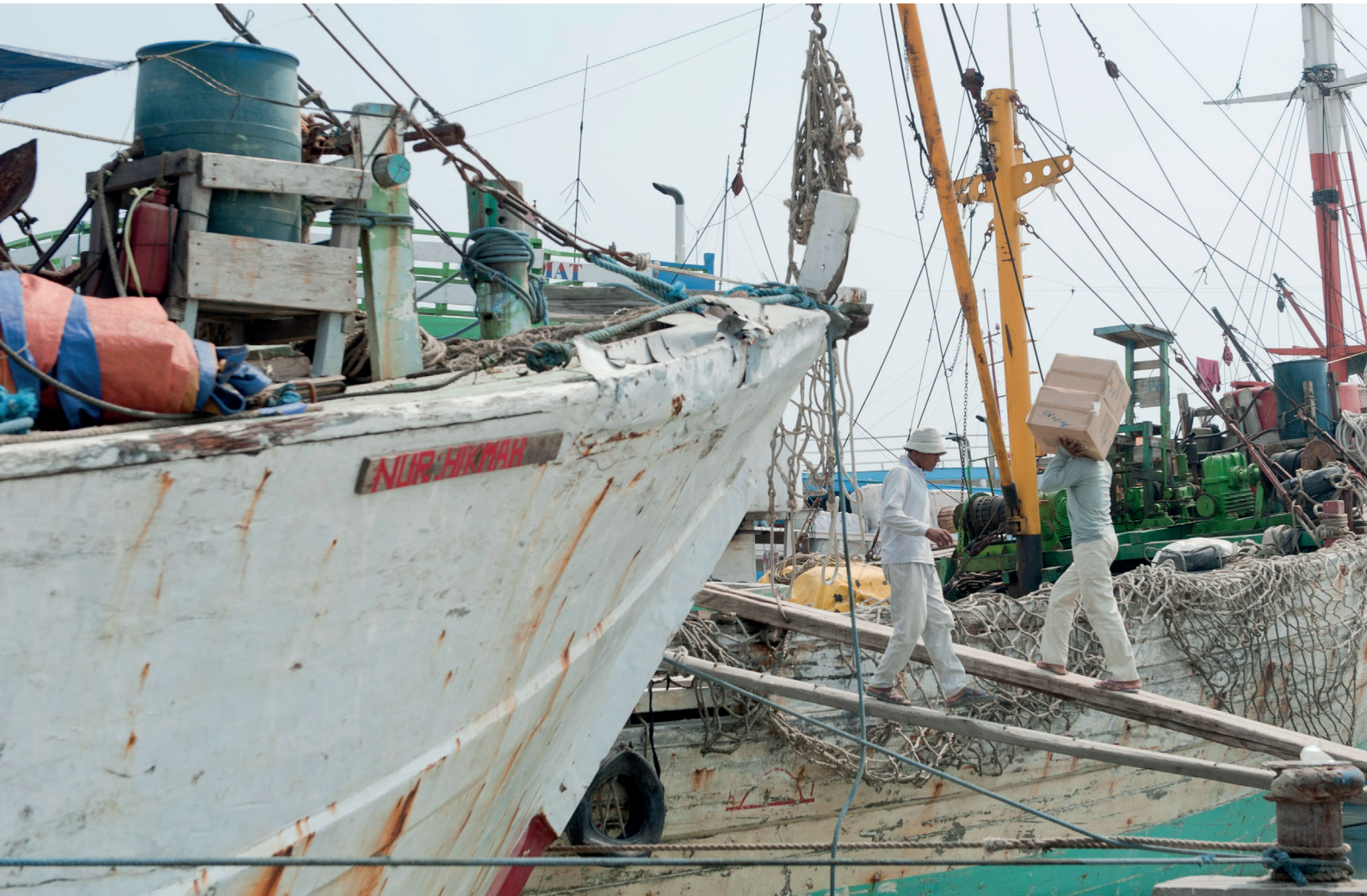
Jakarta, Indonesia