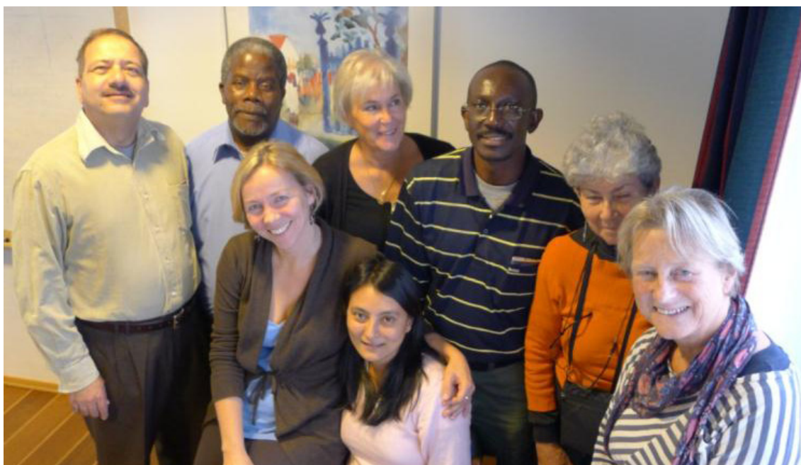
Bildet viser konsulentene da de var sammen i Oslo for å skrive rapportene.

I 2010 ønsket Norad å finne ut om den norske bistanden (eller hjelpen) hadde gjort livet bedre for personer med nedsatt funksjonsevne. Norad ba en gruppe av konsulenter om hjelp. Konsulentene kom fra Norge, Uganda, Palestina, Malawi og Nepal. Konsulentene leste dokumenter og statistikk. De snakket med folk i disse fem landene. Til sammen spurte de mer enn 350 kvinner, menn og barn om deres mening. De snakket spesielt med folk med nedsatt funksjonsevne for å finne ut om livene deres hadde blitt bedre.