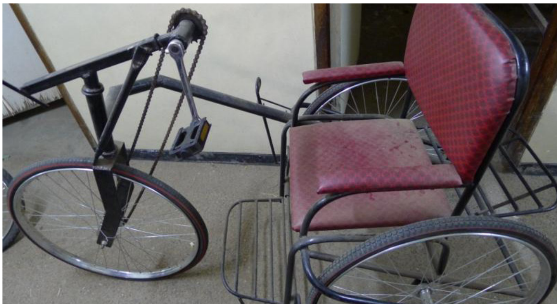
Bilde er fra et senter i Malawi, der de lager sykler, kunstige lemmer og annet utstyr som hjelper personer med funksjonsnedsettelse (fra Rådet for funksjonshemmede i Malawi som heter MACOHA) (Foto: Nora Ingdal / NCG).

Konsulentene fant også ut at de fleste av funksjonshemmet prosjektene fokuserte på personer med fysiske nedsettelse. Personer med utviklingshemming og med nedsatt hørsel var ofte de som fikk minst hjelp.