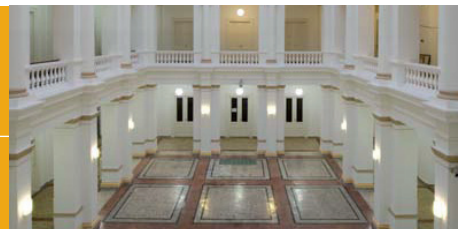
The Royal Norwegian Embassy Sarajevo

Gjennomført av: Scanteam ISBN:978-82-7548-506-7